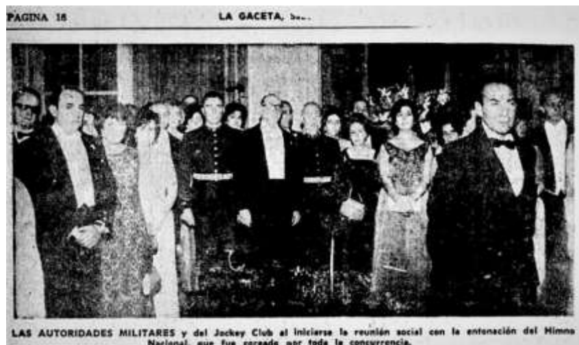
PAGINA 16 LA GACETA, Sa... LAS AUTORIDADES MILITARES y del Jockey Club al iniciarse la reunión social con la antonación del Himno Nacional, que fue coreado por toda la concurrencia.

Durante la noche, autoridades militares y del Jockey Club concurren a la fiesta de conmemoración de la fecha patria e inician la reunión social entonando las estrofas del himno nacional. Allí se presentaban en sociedad a las “señoritas quinceañeras”, integrantes de las familias de la oligarquía tucumana.