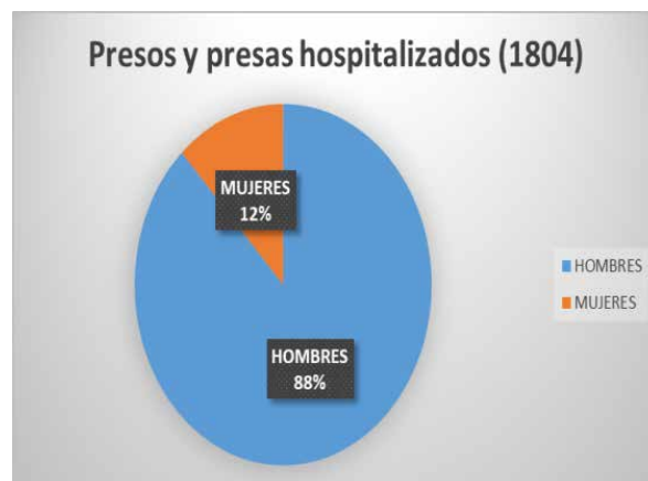
Tabla 1. Ingresos desde la cárcel en el Hospital General de Valladolid, Presos y presas hospitalizados, 1804. (Elaboración propia) ARCHV, Causas secretas, Caja 32, 20. 1803.

Algunos de los presos tuvieron que ser ingresados más de una vez, bien por no esperar a la total curación, bien porque sufrían recaídas, y por ello en este registro no coinciden el número de reclusos o reclusas hospitalizados con el número de ingresos, que fueron superiores, en concreto si los presos que pasaron por el Hospital General suman 117, el número de ingresos se superó en 60, suponiendo 177, 18 de galerianas y 159 de hombres.